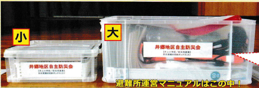
避難所運営マニュアルはこの中！

井郷地区内4カ所の緊急避難場所の防災倉庫には、避難所運営のための資材が 大・小 の 収納ボックス に備えてあります。