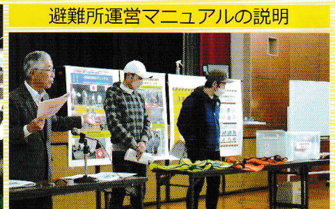
避難所運営マニュアルの説明