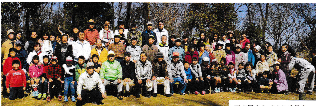
下古屋まちづくり委員会