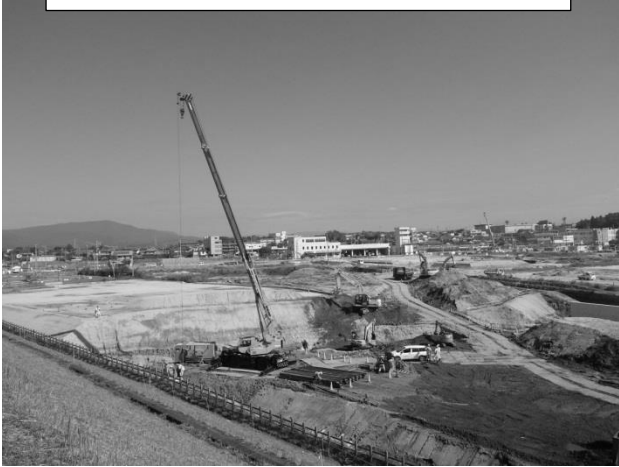
①マレット跡地の整地工事