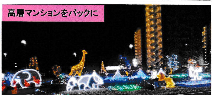
高層マンションをバックに

今年も頑張ってくれました!!子ども会々員のみんなのアイデアを活かして飾り付け作業(11月29日井郷交流館にて)