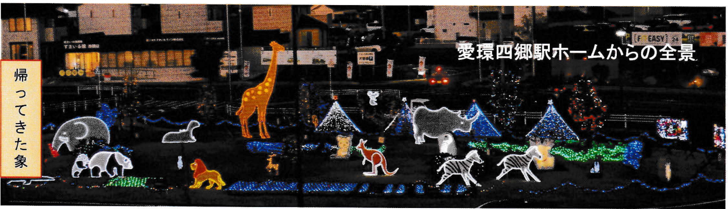
愛環四郷駅ホームからの全景

回を重ねること 13回目 の 飾り付け を11月15日会員総出で賑やかに行いました(都合により子ども達の飾り付けは11月29日に実施)。四郷駅前ロータリー中央全体を活用してたくさんの動物を配置しました。 象さん が可愛くなって帰ってきました。ロータリーを一周して動物が何匹、鳥が何羽いるか探して、楽しんで頂ければ幸いです。