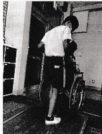
障がいを理解するための実践教室の様子