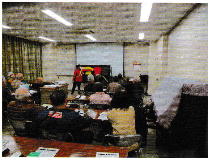
交通安全講習会の様子

また、昨年11月の明け方に起こった御船町地内の事故を受けて、反射材と啓発チラシを高齢者クラブ会員に配布し、夜間等の交通安全の啓発を行いました。