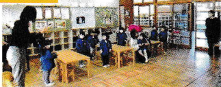
♪歌「手をたたきましょう」