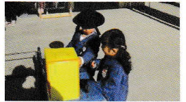
16,893円の募金が集まりました ありがとうございました