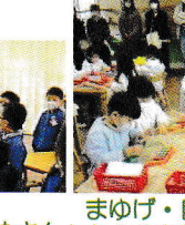
まゆげ・目・鼻・きばを切ってから 目や角のまようを描き のりで貼りました