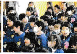
お正月の歌を歌いました