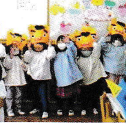
お面をつけて 男女別に豆まきの歌を歌いました