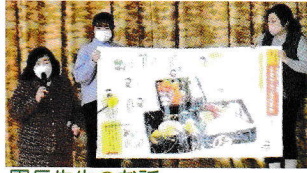
園長先生のお話 「年末・年始のご挨拶とおせち料理のお話」