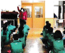
猿投台中学校3年生のお兄さん・お姉さんがおもちゃを作って遊びに来てくれました 楽しかったですね♪