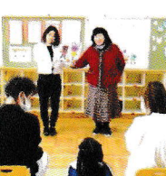
1月から2名のかわいいお友だちが入りました おめでとうございます！