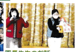
園長先生のお話 「お正月のお話（門松・しめ縄・鏡もち・募金）」