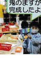
鬼のますが完成したよ！