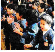
朝の歌と園歌を歌いました