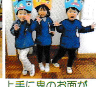
上手に鬼のお面が出来ましたね☆