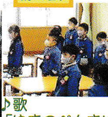
♪歌「ゆきのペンきやさん」