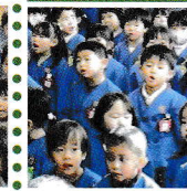
朝の歌と園歌を歌いました