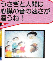
うさぎと人間は心臓の音の速さが違うね！