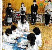
素敵なゆきだるまが完成しましたね♪