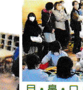
目・鼻・口・まゆげ・つのを のりで貼りました