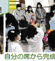
自分の席から完成したますをおうちの方に見ていただきました