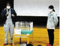
動物愛護センターの方からうさぎについてのお話を聞きました

紙芝居や映像を通して うさぎの飼い方のクイズや説明をしていただきました みんな真剣にお話を聞いていました