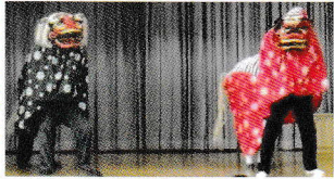
青木台自治区のみなさんに伝統芸能の獅子舞をみせていただきました

頭をかんでもらおうと邪気を食べると言われており無病息災や健やかな成長に繋がると言われています