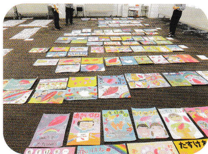
豊田市での審査会の様子