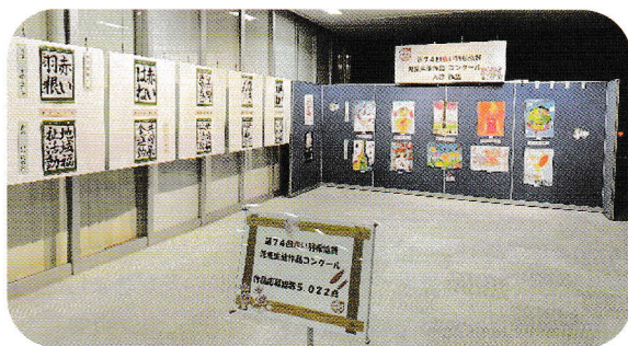
特賞作品の展示の様子