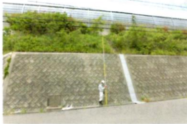
急傾斜地の計測例