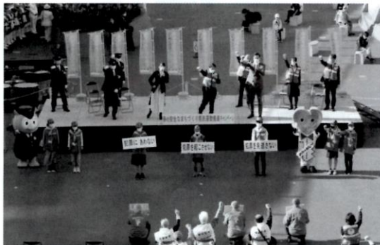
4月4日(月)名古屋市東区東桜一丁目の オアシス21「銀河の広場」において

知事(愛知県安全なまちづくり推進協議会会長) 警察本部長 名古屋市スポーツ市民局長 愛知県商店街振興組合連合会理事長 (公社)愛知県防犯協会連合会会長の出席のもと 春の安全なまちづくり県民運動推進キャンペーンが行われました。