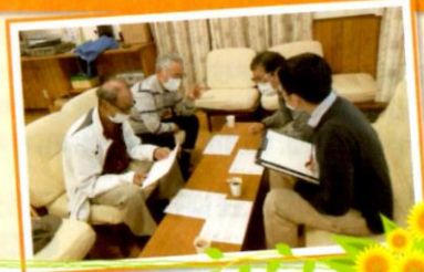
見守りの仕組みづくりの検討の様子▶

高橋・松平出張所は、地域住民が地域の現状を学ぶ機会の設定や、見守り・支え合いの企画・仕組みを一緒に考え、実践できるように支援しています。