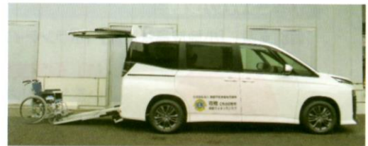
寄贈いただいた福祉車両（ヴォクシー）