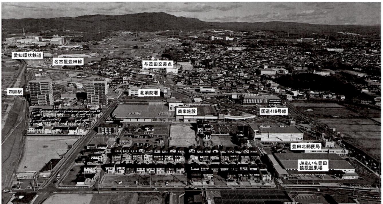
南側から地区全体を望む 令和3年12月撮影