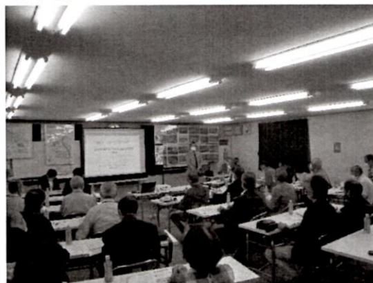
視察研修会の様子

四郷土地区画整理事業の概要説明、現地視察の後、事業全体を通しての苦労した点や魅力あるまちづくりの方法についてなど多くの質問があり、大変有意義な視察研修会となりました。