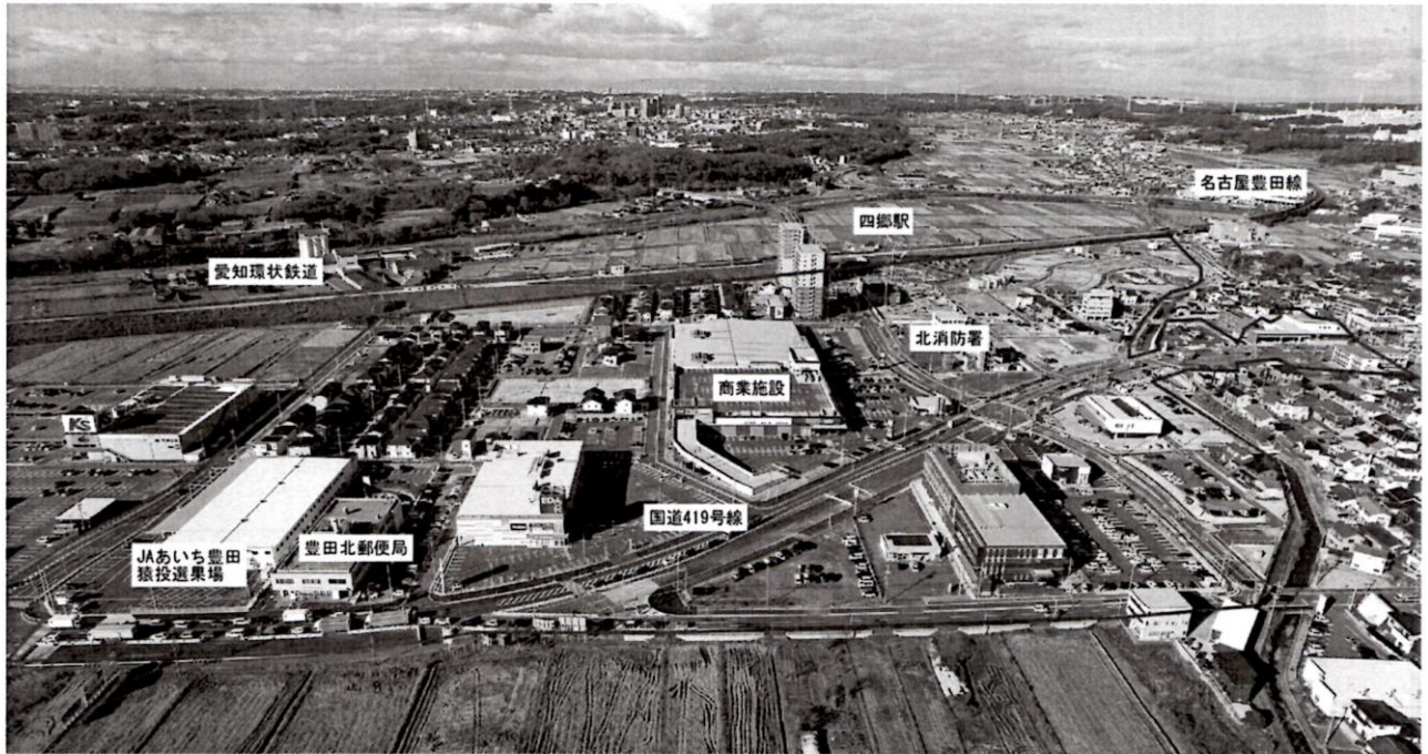
東側から地区全体を望む 令和3年12月撮影

昨年10月1日に地区全域の使用収益が開始され、戸建住宅の建築も着々と進んでいます。