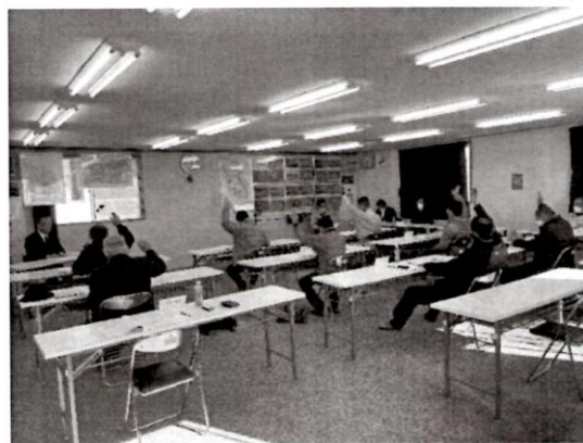
今回も新型コロナウイルス感染症の影響で縮小開催となりました。