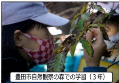
豊田市自然観察の森での学習(3年)