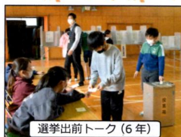
選挙出前トーク(6年)