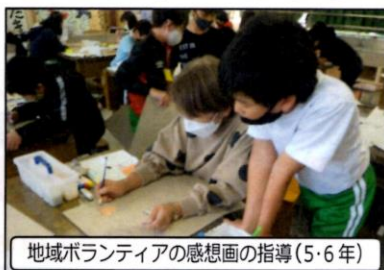
地域ボランティアの感想画の指導(5・6年)