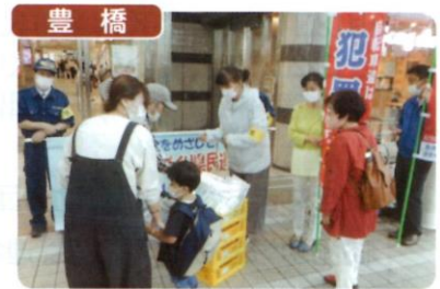
豊橋市防犯協会連合会では、安全なまちづくり県民運動の一貫として豊橋駅通路で防犯グッズ、うちわを自由に持ち帰っていただく方法で配布を行いました。