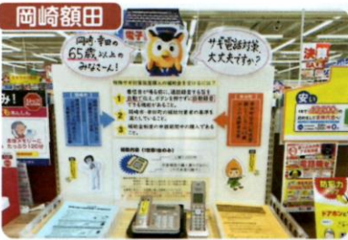
岡崎額田防犯団体連絡協議会では、管内家電量販店の協力を得て「特殊詐欺対策電話特設コーナー」を設置、岡崎市・幸田町の補助金対象機種種の普及促進を図りました。