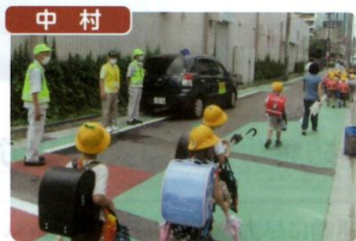
則武学区防犯協議会では青パトの増車に伴い、中村警察署長、区役所区政部長を来賓に迎え出発式を行った後、ほのか小学校低学年の下校時見守り活動等を実施しました。