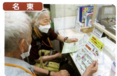
名東署及び防犯協会連合会では、県内初の取組として、賛同企業の協力を得て、特殊詐欺被害撲滅のための防犯電話助成事業に取組み、区民に被害防止を呼びかけています。