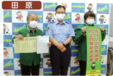
特殊詐欺被害を阻止した店舗としてセブンイレブン田原本町店に署長感謝状と振り込め詐欺被害防止対策優良店舗の懸垂幕が贈呈されました。