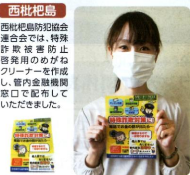
西枇杷島防犯協会連合会では、特殊詐欺被害防止啓発用のめがねフリーナーを作成し、管内金融機関窓口で配布していただきました。