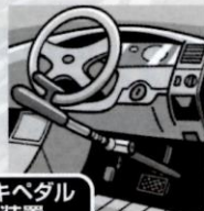
ブレーキペダル固定装置