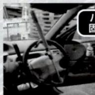
ハンドル固定装置