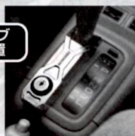
シフトノブ固定装置