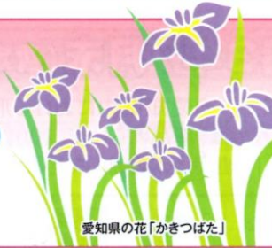
愛知の花「かきつばた」

発行所：(公社)愛知県防犯協会連合会 名古屋市昭和区円上町26番15号 愛知県高辻センター 2階 (052)871-2110