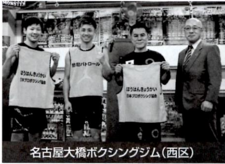
名古屋大橋ボクシングジム(西区)