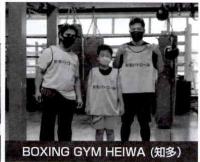
BOXING GYM HEIWA (知多)