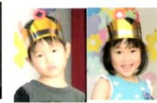
ホールでのお誕生会后お部屋でおうちの方と一緒にやつを食べました