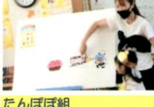
たんぼぼ組 パネルシアター「おたんじょうびのハッピールーレット」