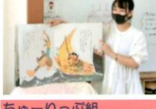
ちゅーりっぷ組 大型絵本「にゃんきちっかのだいぼうけん」