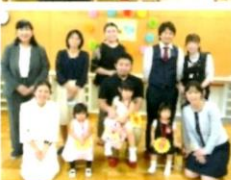
7月からいちご組に かわいいお友だちが 3名入りました！ おめでとうございます！