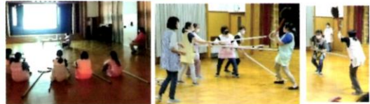
不審者が園内に侵入した際に こどもたちの身を守るため さすまた訓練を行いました 園内でスライドを見た後 実際にさすまたを使用して勉強しました