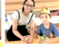
おうちの方と一緒にやつを食べました