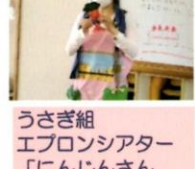
うさぎ組 エプロンシアター「にんじんさんなぜなぜあかい」