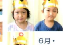
6月・7月生まれのおともだち