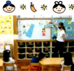
園長先生からの放送で七夕のお話を聞きながら 担任の先生が行ったペープサートを見ました