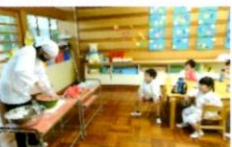
とっても甘くておいしいよ～！