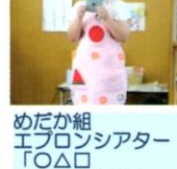
めだか組 エプロンシアター「△△□□なーにかな」