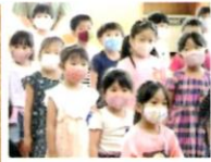
歌♪「ハッピーバースデー トゥーユー」「くじらのバス」