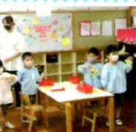
自分の席から おうちの方に 出来上がった作品を 見ていただきました