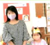
おうちの方からお祝いの言葉をいただきました