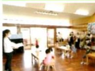
朝の会を行いました