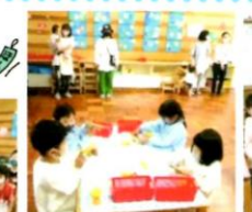
七夕の製作 「彦星さま」 星に体や顔 帯などを のりで貼りました