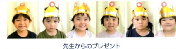
先生からのプレゼント