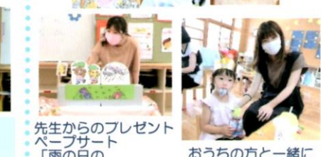
先生からのプレゼント ペープサート「雨の日のハッピーバースデー」