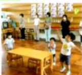
歌「やまびこ ごっこ」♪