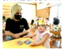
おうちの方と一緒にやつを食べました