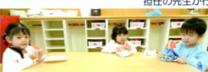
七夕のお話の後 お部屋でスイカを食べました