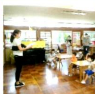
朝の会を行いました