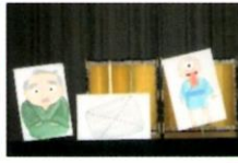
先生からのプレゼント ペープサート「ばけものつかい」