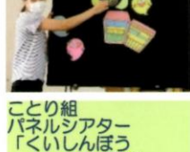
ことり組 パネルシアター「くいしんぼうおぼけ」