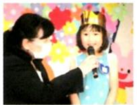
自分のお名前や大きくなった何になりたいかを発表しました