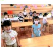
歌♪「ハッピーバースデー トゥーユー」「スターマンの歌」