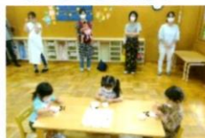
七夕の製作 「織姫さま・彦星さま」 顔や着物にシールを 貼りました