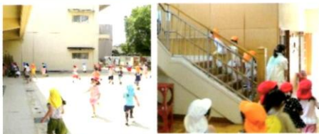
西門側から不審者が侵入した設定で鍵のかかる部屋に避難しました