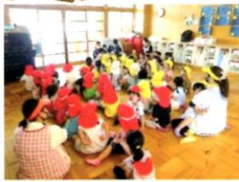
園長先生からの放送を真剣に聞くことができました