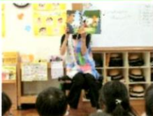
担任の先生に防犯についての紙芝居を読んでもらい「5つのお約束」を覚えてもらいました