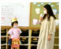
おうちの方に赤ちゃんの頃のお話を聞きました