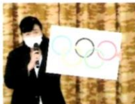
園長先生のお話「オリンピック」