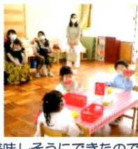
美味しそうにできたので すいかを食べるまねを しました