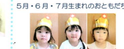
5月・6月・7月生まれのおともだち