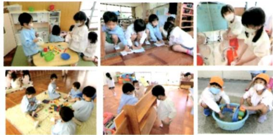
外や室内で使うおもちゃやお部屋の大掃除をしました☆きれいな気持ちで2学期が迎えられますね☆