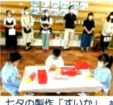
七夕の製作「すいか」 のりで折り紙の種を すいかに貼りました