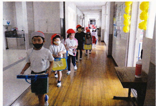
マスク・1列歩行での学校探検(1,2年生)

愛知県に緊急事態宣言が発令され、学校の教育活動も大きな影響を受けています。子どもたちが楽しみにしていた運動会や修学旅行も延期せざるを得ない状況になってしまいました。保護者の皆様、地域の皆様におかれましても、ご迷惑をおかけして申し訳ありません。日常の活動も様々な感染防止対策や制限を受けていますが、4月当初の状況から大きく後退し、今が一番悪い状況とされています。しばらく我慢をして、引き続き感染対策を万全にしていきたいと思えます。また、このような状況ですが、少しでも潤いのある学校生活になるように工夫していきたいと思っています。