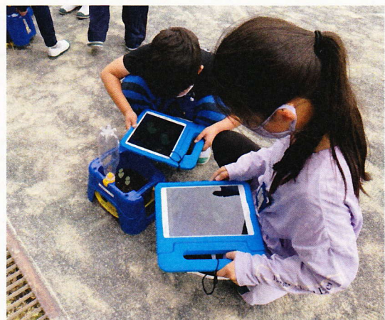
iPadを使って植物の生長を記録(3年生)

新学習指導要領に明記されている「情報活用能力の育成」や「ICTを活用した学習活動の充実」をめざして、昨年度、豊田市より児童一人に一台ずつiPadが配置されました。本年度は、具体的に活用していくことで、個別最適化学習の充実に取り組んでいきたいと思えます。また、状況によってはご家庭でリモートでの授業も必要になってくるかもしれません。そのため、6月4日(金)に持ち帰り訓練を行います。ご家庭で、「Wi-Fi環境が整っているか、そして、確実に繋がるか」をご確認ください。また、学習用タブレットということをおまえ、使い方や使う内容等についても、ご家庭でご指導くださるようお願いいたします。