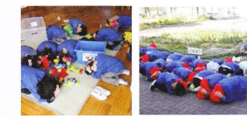
予告なしの避難訓練でしたがすぐにだんご虫の姿勢になることができました