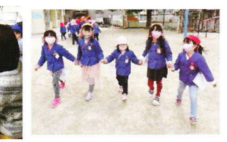
ペアで手をつないで回りました