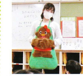
先生からのプレゼント エプロンシアター 「くいしんぼゴリラの歌」