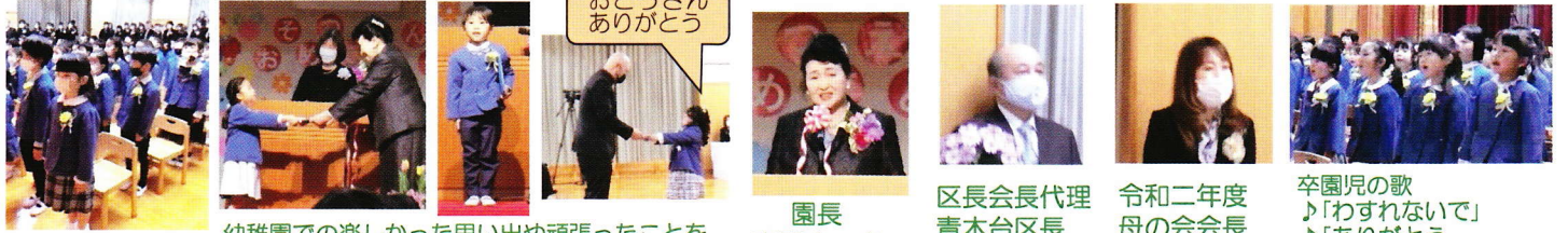
幼稚園での楽しかった思い出や頑張ったことを一人一人発表しました