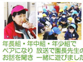
年長組・年中組・年少組でペアになり 放送で園長先生のお話を聞き一緒に遊びました