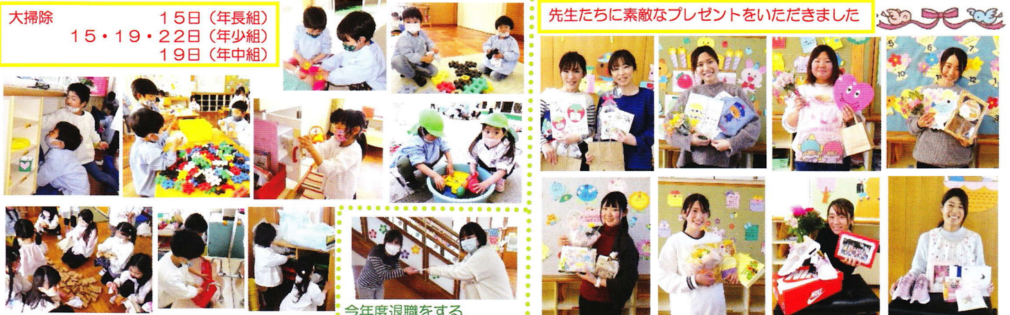
一年間過ごしたお部屋や外のおもちゃの大掃除をしました きれいになりましたね