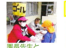
園長先生と事務長先生にゴールのシールをはってもらいました