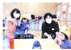
お家の方と一緒に おやつを食べました