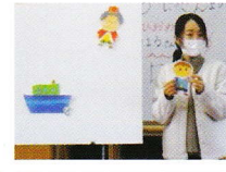
めだか組 パネルシアター 「パズル王子」