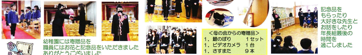
幼稚園には寄贈品を職員にはお花と記念品をいただきましたありがとうございました