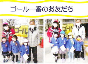
ゴール一番のお友だち