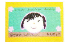
年少組から手紙入れ