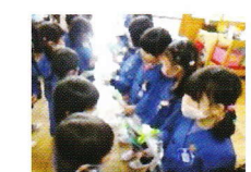
午後、年少組・年中組から年長組へお礼のプレゼントや輪つなぎを作りました