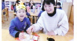
おうちの方と一緒に おやつを食べました