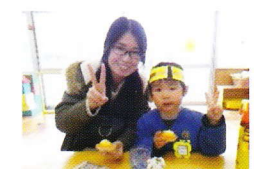
おうちの方と一緒に おやつを食べました