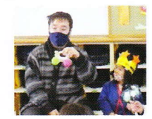
お家の方から赤ちゃんの頃のお話を聞きました