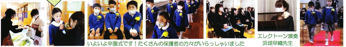
いよいよ卒園式です!たくさんの保護者の方々がいらっしゃいました