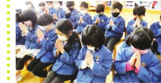
東日本大震災で亡くなられた方々に黙祷を捧げました