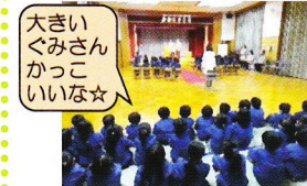
年中組が卒園式の練習を見学しました