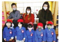
お部屋でゲームを楽しみました