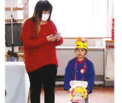
おうちの方からお祝いの言葉をいただきました