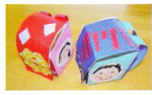
年中組からランドセルの小物入れ