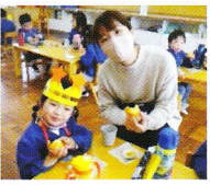
お家の方と一緒に おやつを食べました♪