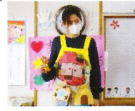
うさぎ組 エプロンシアター 「3匹のこぶた」