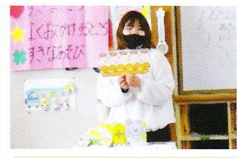
ことり組 お誕生日シアター 「ハッピーかんむりでおめでとう!」