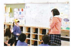
おうちの方からお祝いの言葉をいただきました