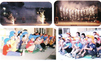
先生たちがやってくれた噴出花火やナイアガラ花火 とてもきれいでした！素敵な思い出になりました☆