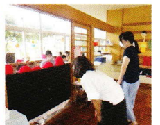
お部屋でゲームを楽しみました