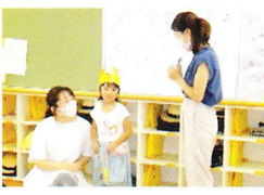
おうちの方からお祝いの言葉をいただきました