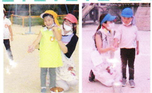
花火 一人一人手持ち花火を園庭でやりました