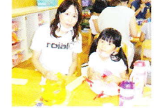
おうちの方と一緒に おやつを食べました