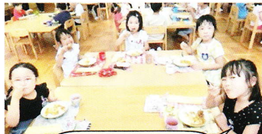
みんなで食べるとおいしいね☆