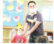
おうちの方に 赤ちゃんの頃のお話を聞きました