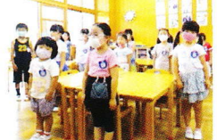
学年の歌♪年長組「しりとりうた」