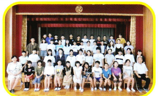
6年生の皆さんには最後の同窓会でした みんな元気で大きくなってくださいね！