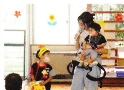
おうちの方からお祝いの言葉をいただきました