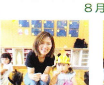
おうちの方と一緒に おやつを食べました