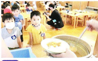
夕食のメニュー・カレーライス・福神漬・ﾌﾞﾈﾞｰﾘｰ