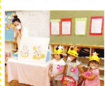
先生からのプレゼント パネルシアター「お誕生日ケーキにデコレーション」