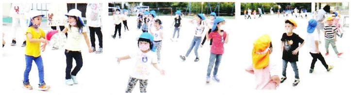
夜が集い みんなでゲームをしたりフォークダンスをしたり夜の集いをおもいきり楽しみました