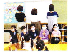
お部屋でゲームを楽しみました