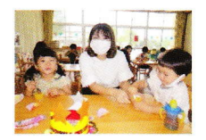
おうちの方と一緒に おやつを食べました