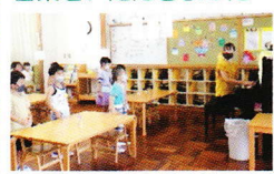
学年の歌♪年中組「とんでったバナナ」