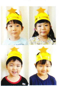
8月生まれの お友だち