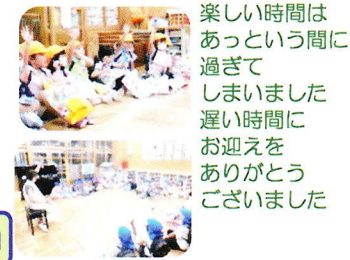
楽しい時間はあっという間に過ぎてしまいました遅い時間にお迎えをありがとうございました