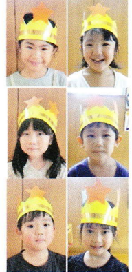
8月生まれの お友だち