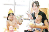
おうちの方と一緒に おやつを食べました