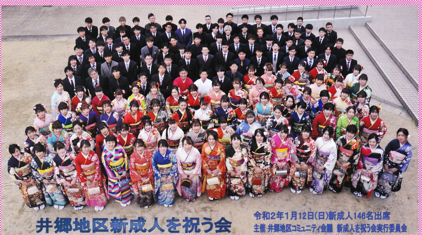
井郷地区新成人を祝う会