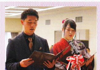
晴れやかに二十歳の門出