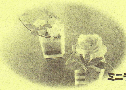
ミニテコアレンジメント