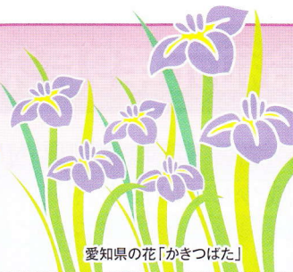
愛知県の花「かきつばた」

発行所：(公社)愛知県防犯協会連合会 名古屋市昭和区円上町26番15号 (愛知県高辻センター 2階) (052) 871-2110