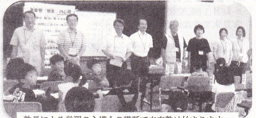
塾長による学習の心構えの講話で未来塾は始まります。