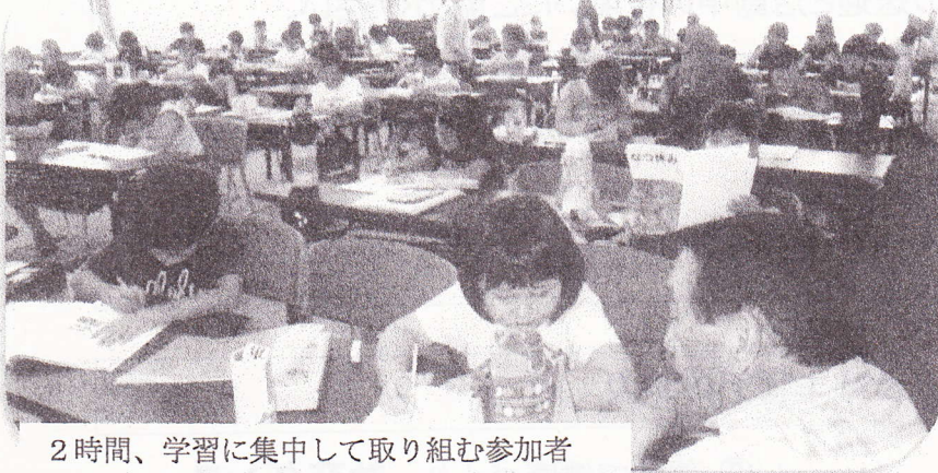
2時間、学習に集中して取り組む参加者