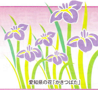
愛知県の花「かきつばた」

発行所：(公社)愛知県防犯協会連合会 名古屋市昭和区円上町26番15号 愛知県高辻センター 2階 (052) 871-2110