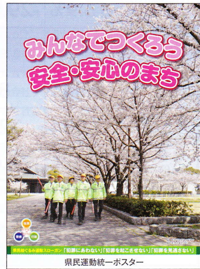
県民運動統一ポスター

木々が芽吹いて新緑が一段と映え、陽だまりより日差しの方が少しだけ気になる季節になりました。