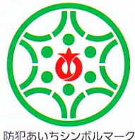
防犯あいちシンボルマーク