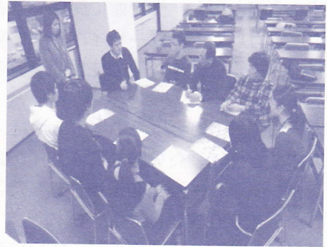
写真：意見交換会の様子 (子ども委員と一緒に)

今年度、青少年健全育成推進協議会では、青少年のスマートフォンの利用に係るトラブルの未然防止を重点取組項目として掲げています。その活動の一環として、12月16日(日)に青少年センターで、豊田市子ども会議(※)の子ども委員とスマートフォンの利用に関する意見交換会を実施しました。子どもたちからは、実際に自分や友人がトラブルにあった例があげられ、子どもたちの周りには、たくさんの危険が潜んでいることを実感させられました。この結果を踏まえ、青少年健全育成推進協議会では、スマートフォンの利用方法について定めた「豊田のルール4か条」の更なる普及・啓発活動に努めていきたいと思ひます。