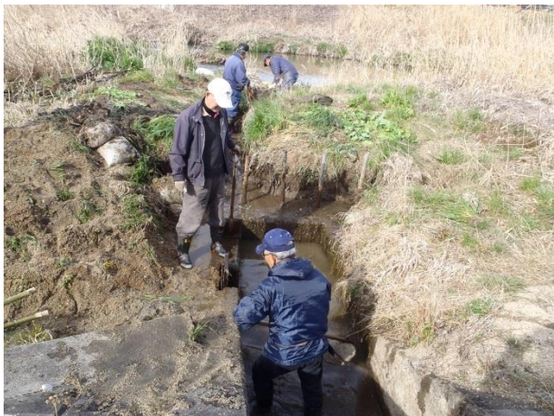
〔竈川取水口の泥上げ作業〕