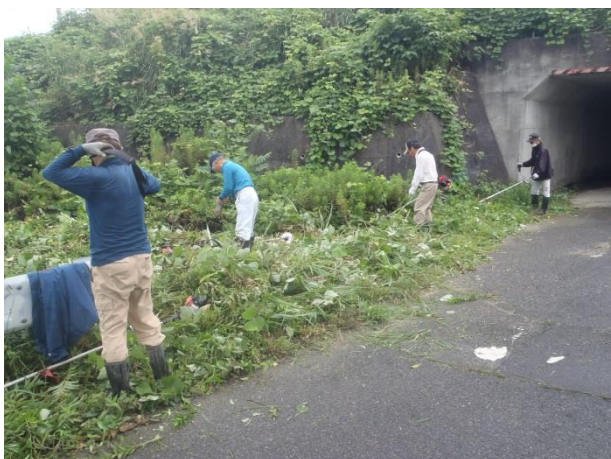
〔農道や水路の草刈り作業〕