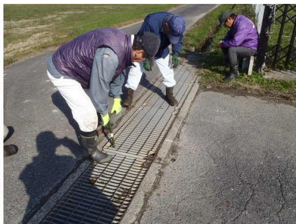
〔農道や水路の修繕〕