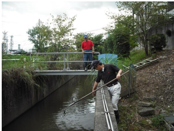
〔農業用水路の保守・点検〕